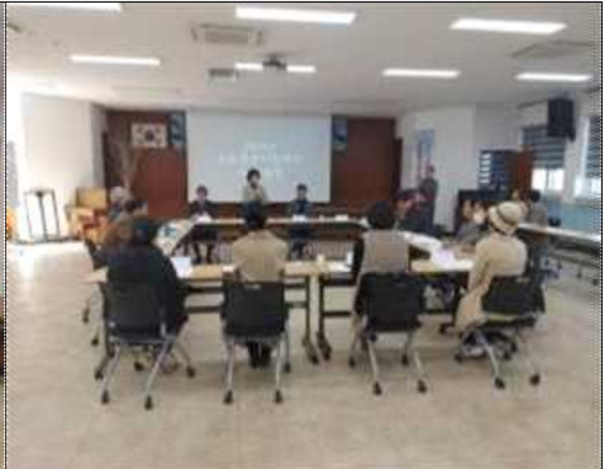
귀농귀촌 멘토 워크숍 의견 수렴 2