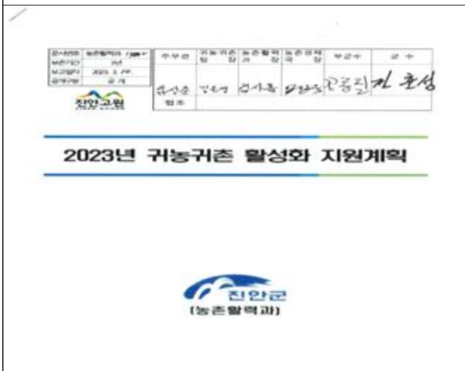
귀농귀촌 활성화 지원계획 수립