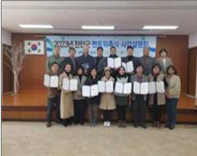
귀농귀촌 멘토 워크숍 의견 수렴 1